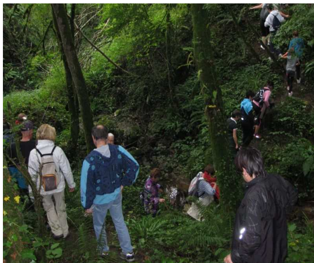
La montée vers Saint Marcel de Camp

Merci à tous, rendez vous en 2014 à Moularès pour une 7ème édition